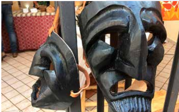
Masky v Mamoiadě