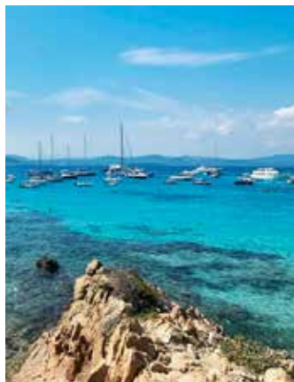
Souostroví La Maddalena