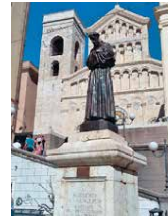
Katedrála v Cagliari