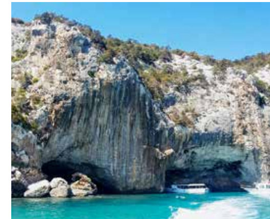
Grotta del Bue Marino