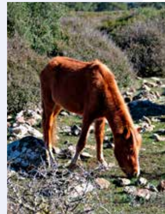
Kůň na Giara di Gesturi